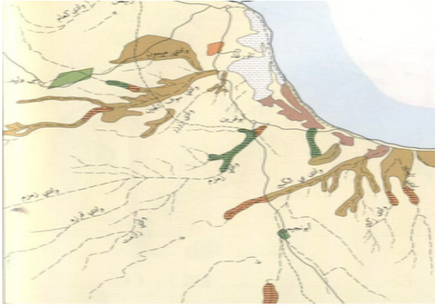
شكل 2. يوضح منطقة الدراسة و المشاريع الزراعية.

الوشكه، نيناه، ميمون، السويح، الجفرة، و قرارة القطف، جدول(1) يوضح تلك المشاريع وسنة التنفيذ. ومن أهم المحاصيل الزراعية التي تزرع في تلك المشاريع هي الشعير والقمح ومحاصيل الاعلاف والبطيخ والشمام وبعض الخضروات إلى جانب غرس الزيتون والنخيل وأشجار الفاكهة الأخرى.