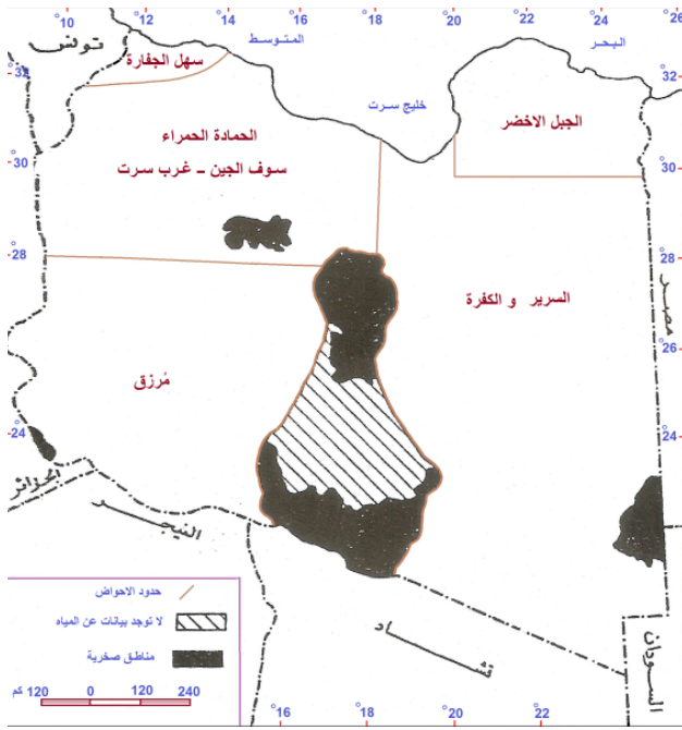
شكل 1. نظم الاحواض الجوفية معدل من (Pallas, 1980)

تهدف هذه الدراسة إلى معرفة مدى إمكانية تغذية خزان ككله الجوفي بمنطقة المشاريع الوسطى والخروج ببعض التوصيات التي من شأنها أن تساعد في وضع استراتيجية وخطة مائية بعيدة المدى والتي من خلالها يتم استغلال الخزان دون تعرضه للنضوب في وقت قصير نسبياً على الأقل. للوصول إلى هذه النتائج يتطلب معرفة مقدار الهبوط لمنسوب المياه بالخزان خلال فترة الدراسة وتقدير كمية المياه المسحوبة خلال نفس الفترة. كذلك معرفة التغير الكيميائي الذي طرأ على نوعية المياه بالخزان كنتيجة لاستغلاله.